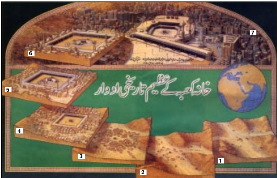
കഅബയുടെ നിർമ്മാണം വിവിധ കാലഘട്ടങ്ങളിൽ

കഅബത്തുല്ലായെ ഹസ്റത്ത് ഇബ്റാഹീം നബി (അ) നിർമ്മിച്ചിരുന്നത് ചുവന്ന കല്ലുകൾ കൊണ്ടായിരുന്നു. അത്